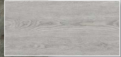
Weiße Eiche Synchronprägung