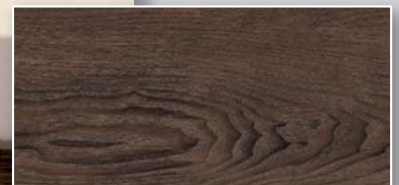
Schwarze Eiche Synchronprägung