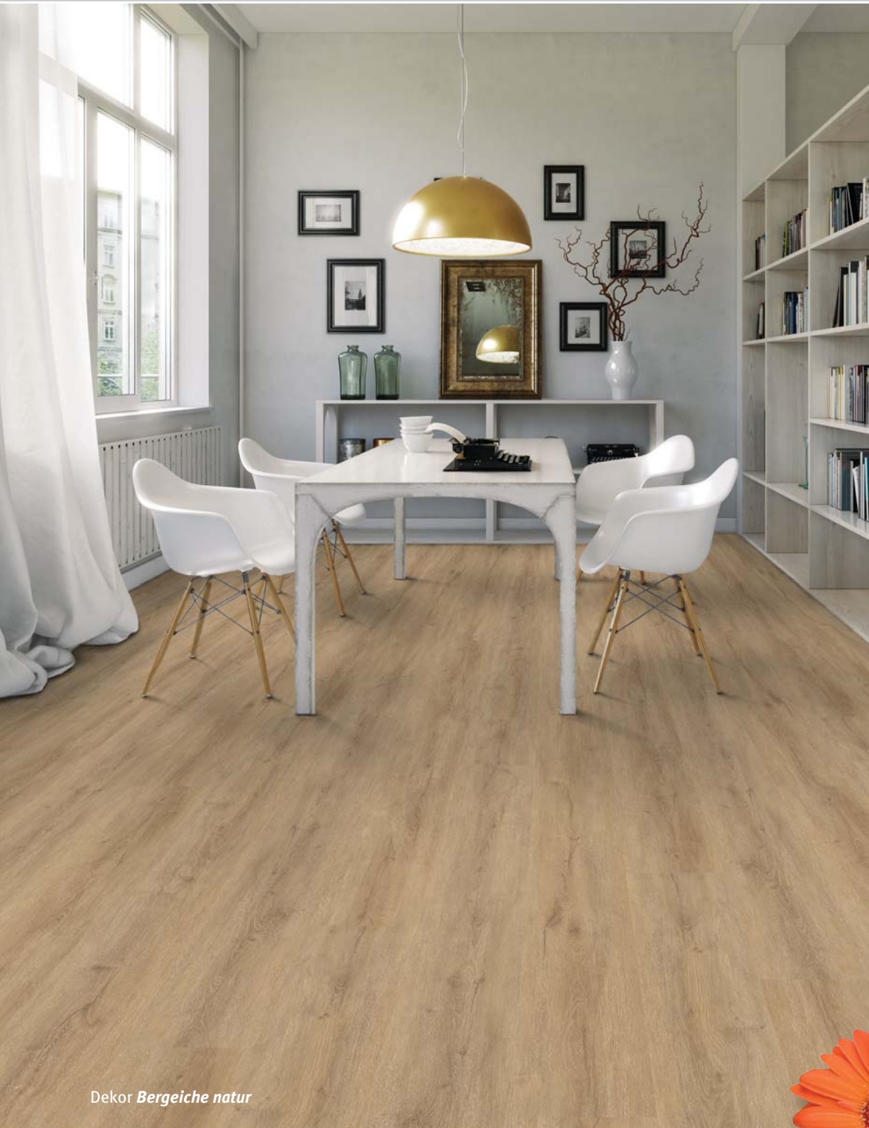
Dekor Bergeiche natur

Designvinyl-Fertigfußboden für höchste Beanspruchung.