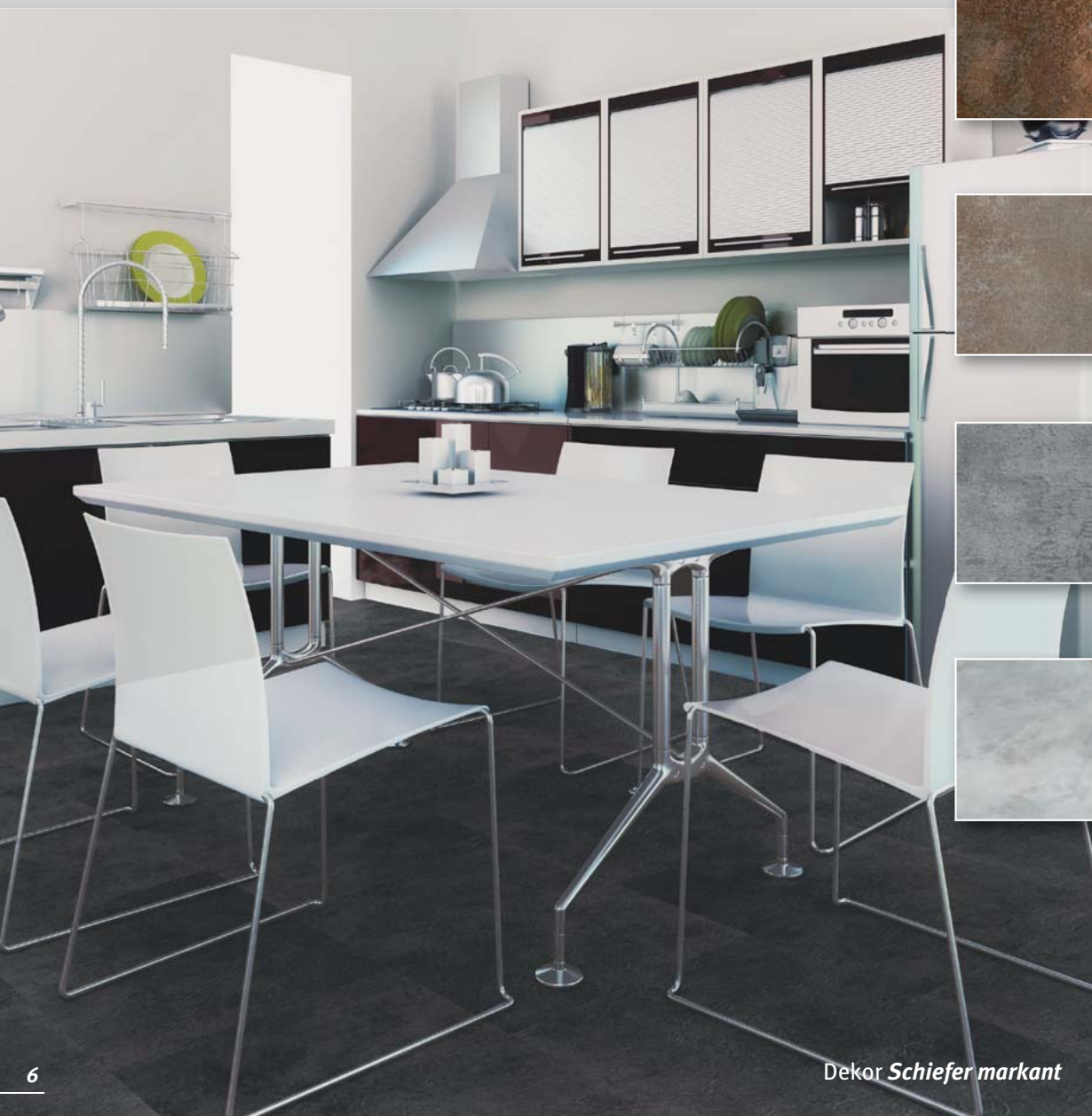
Dekor Schiefer markant