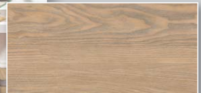
Helle Eiche Synchronprägung