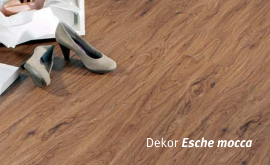
Dekor Esche mocca