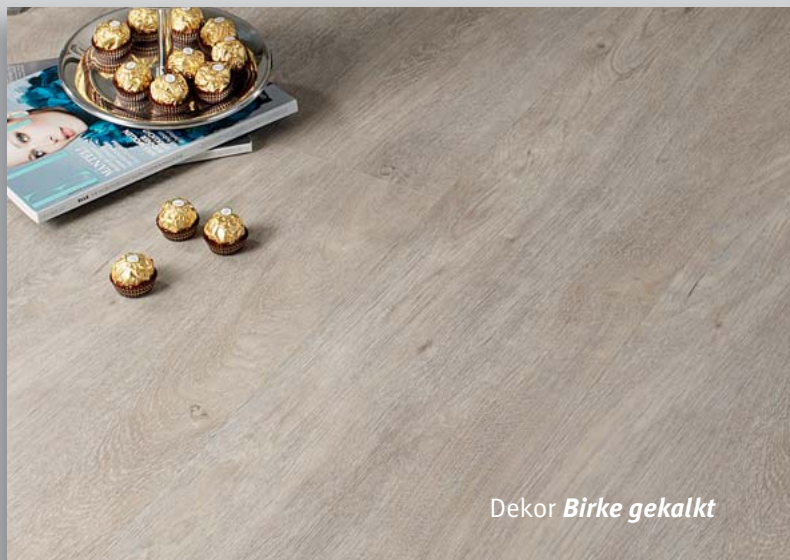
Dekor Birke gekalkt

Vinylnan object ist ein in jeder Beziehung herausragender Design-Bodenbelag. Er ist der perfekte Boden in privaten Wohnräumen genauso wie in Büros, Verkaufsräumen, Boutiquen jeder Art oder sonstiger repräsentativer und beanspruchter Räume. Der Boden mit dem perfekten Auftritt.