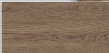
Dunkle Eiche Synchronprägung