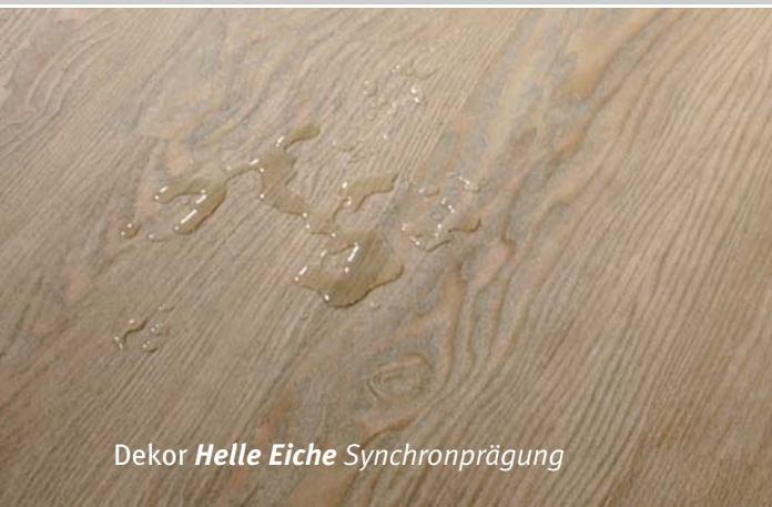
Dekor Helle Eiche Synchronprägung